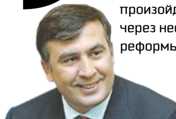
Михаил Саакашвили, президент Грузии

«Мы тоже проводили реформы в различных областях. Важно исключить коррупцию, но это не произойдет очень быстро, а только через несколько лет, поскольку на реформы нужно время»