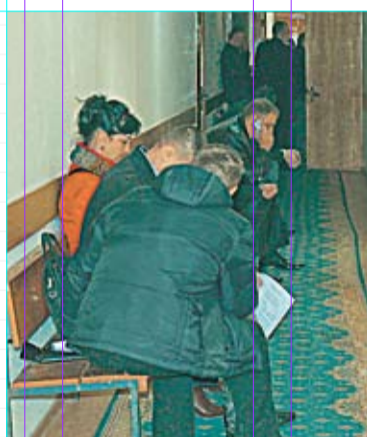
Participanții la procese așteaptă la ușile birourilor judecătorilor de la Judecătoria Buiucani unde au loc ședințele de judecată

La 9 aprilie curent, la judecătoria sectorului Buiucani din municipiul Chișinău erau planificate 15 ședințe de judecată. Nici unul din aceste procese nu s-a desfășurat în sala de ședință, iar participanții așteptau în fața birourilor judecătorilor ca să fie chemați de către magistrați. Or, anume în birourile judecătorilor au avut loc toate cele 15 ședințele de judecată. Președintele Judecătoriei Oleg Sternioală afirmă că instituția pe care o conduce are o singură sală de ședință pentru procese de judecată, însă nici ea nu este echipată corespunzător. „În cadrul Judecătoriei Buiucani sunt angajați 22 de judecători. Este bine ca pentru acest număr de magistrați să fie cel puțin cinci săli