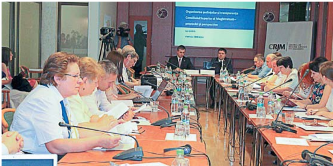
В ходе презентации исследования «Организация заседаний и прозрачность Высшего совета магистратуры – вызовы и перспективы» были изложены рекомендации по улучшению веб-страницы ВСМ.

В 2013 году, в рамках Программы по консолидации государственных учреждений Молдовы (ROLISP) Агентства США по международному развитию (USAID) было закуплено оборудование для аудио- и видеозаписи и прямой трансляции заседаний ВСМ, однако оно использовалось только один год, в старом здании ВСМ по улице Михаил Когалничану в Кишинэу. После переселения учреждения в 2014 году в новое здание, расположенное по ул. Михая Еминеску, аудио-видеооборудование не было